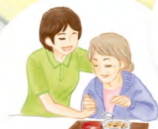
食事レクリエーション

「全国の郷土料理」や「胃腸に良い食事週間」、「カルシウムたっぷりイライラ防止の食事週間」などバラエティに富み、栄養バランスのとれた食事を提供しています。