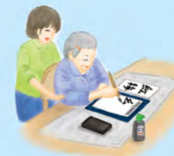
レクリエーション（書道）

送迎・入浴・食事・機能訓練を行い、日常生活を維持していくことや、集団での社会的な交流を図り豊かな在宅生活を送ることができるよう支援します。