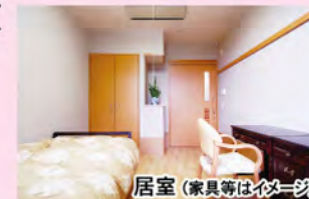
居室（家具等はイメージ）